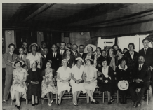
Homenaje a Rosario de Velasco para celebrar su éxito en la Exposición Nacional de Bellas Artes, junio de 1932

Participa en la Exposición Nacional de Bellas Artes, en Madrid. Presenta por primera vez Adán y Eva , junto con Chica ciega . Obtiene una segunda medalla con Adán y Eva pero según la crítica mereció haber sido la ganadora.