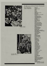
Revista Novecento, núm. 10, Zaragoza, primavera de 1935. Biblioteca y Centro de Documentación Museo Nacional Centro de Arte Reina Sofía, Madrid