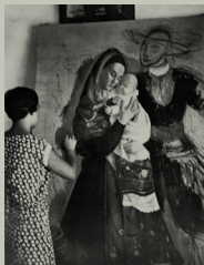
Rosario de Velasco pintando Maragatos , hacia 1934

Presenta Maragatos al Concurso Nacional de Pintura y gana un segundo premio. Volverá a participar de nuevo en la Exposición Nacional de Bellas Artes, presentando esta vez Lavanderas con la que obtiene buenas críticas.