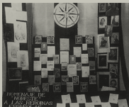
Escaparate de la Librería Internacional, Zaragoza, foto Darguieles, publicada en la revista Novecento, núm. 11, época I, Zaragoza, verano de 1935

Presenta Gitanos y Pensativa a la Exposición de Bellas Artes organizada por la Asociación Española de Pintores y Escultores.