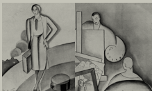
Ilustraciones de Rosario de Velasco para el cuento Claire-Louise , de María Teresa León, publicado en La Esfera , núm. 8.615, 5 de julio de 1930, pp. 30-31

Ilustra Cuentos para soñar escrito por María Teresa León, prologado por María Goyri de Menéndez Pidal. También acompañaría con sus dibujos algunos de los cuentos que León publica en la prensa de la época.