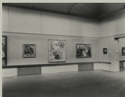
Fotografía de la sala de exposiciones del Carnegie Internacional

En otoño es invitada a formar parte del elenco español en la exposición internacional organizada por el Carnegie Institute de Pittsburgh, con su obra Gitanos .